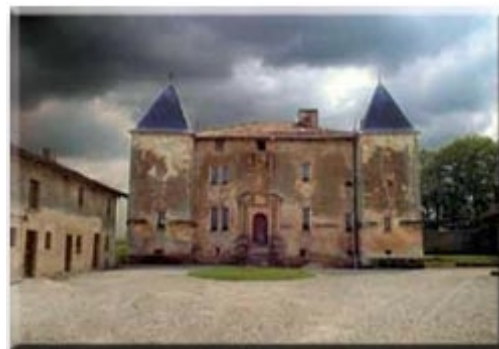
Mouzay Charmois : Le vieux château

Le portail de l'église de Saint Dagobert découvert dans les fouilles des bastions de l'ancienne citadelle. Il peut être vu dans la salle Saint Dagobert sur la place de la Raymond Poincaré